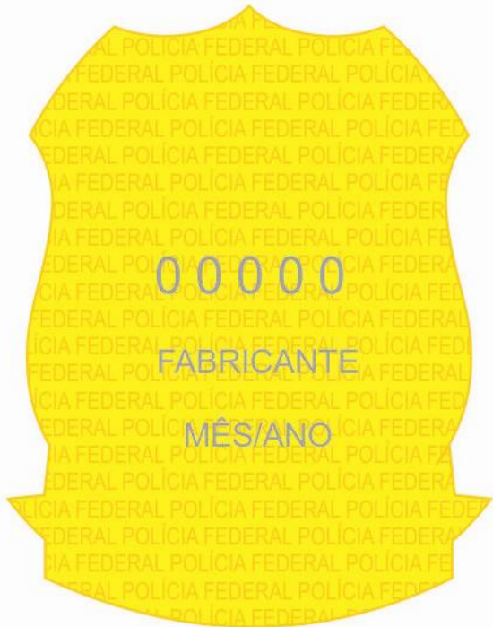
FIGURA 6 - VERSO DO DISTINTIVO METÁLICO

1.26. No coração do emblema destacam-se as armas nacionais que se descrevem segundo a Lei nº 5.700, de 1º de setembro de 1971, na forma que segue: