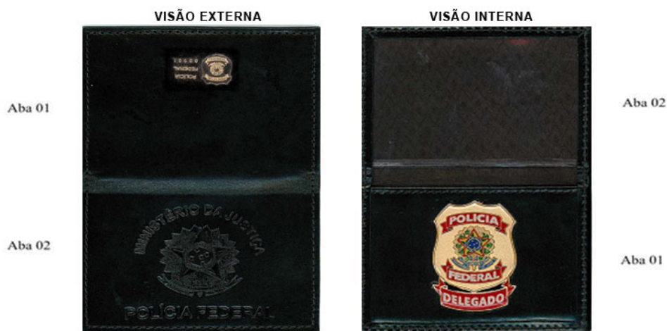
FIGURA 1 - PORTA FUNCIONAL (IMAGEM MERAMENTE ILUSTRATIVA)

1.9. Internamente, na aba nº 1 (visão interna – FIGURA 1), em forma de bolso, será afixado o distintivo, emblema + listel do cargo (FIGURA 2), da Polícia Federal em metal, medindo o emblema 45 mm de altura x 36 mm largura, +- 1,0 mm, e o listel do cargo, medindo 8 mm de altura x 36 mm de largura, +- 0,5 mm. As cores do emblema deverão seguir o padrão da Polícia Federal, conforme FIGURA 3.