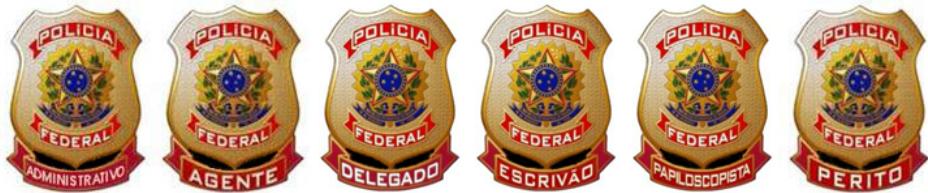
FIGURA 5 - VARIAÇÕES DO DISTINTIVO METÁLICO

1.24. A frente do emblema seguirá o padrão estabelecido pelo Manual de Identidade Visual da Polícia Federal e o Decreto nº 98.380/1989, de 9 de novembro de 1989, no que se refere às cores e proporções.